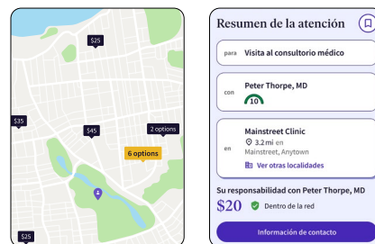
Ejemplo con fines ilustrativos solamente. Los costos y la cobertura pueden variar.